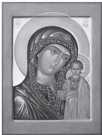
Казанская икона Пресвятой Богородицы. Сийская иконописная мастерская.

сте, прибыл в Палестину и горячо воспринял учение от Самого Господа. В числе 70-ти учеников св. Лука был послан Господом на проповедь о Царствии Небесном. Предание относит апостолу Луке написание первых икон Божией Матери, а также икон святых апостолов Петра и Павла. Евангелие написано им в 62-63 годах в Риме, под руководством апостола Павла. Св. Лука написал также книгу Деяний святых апостолов. Проповедовал в Ливии, Египте, Ахайи, Фиваиде. В городе Фивы мученически окончил земной путь.